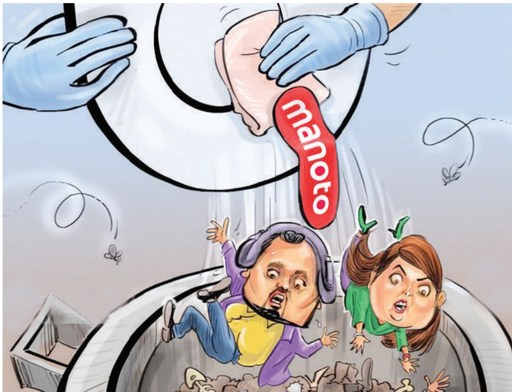
می‌خواست من و تو محو شویم، به زبانه‌ان تاریخ پیوست؛ بی‌پولی تل‌آویو تعطیلی منو تو