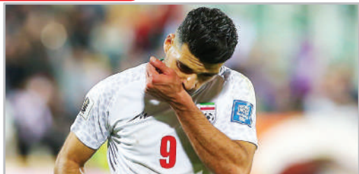
دیدار تیم‌های فوتبال ایران و هنگ‌کنگ