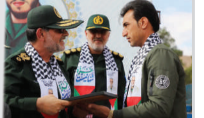
برگزاری اولین جشنواره فرهنگی ورزشی کارکنان وظیفه سپاه پاسداران انقلاب اسلامی در شیراز

نماینده ولی فقیه در فارس و امام جمعه شیراز: جوان ایرانی پای کار ایستاده است