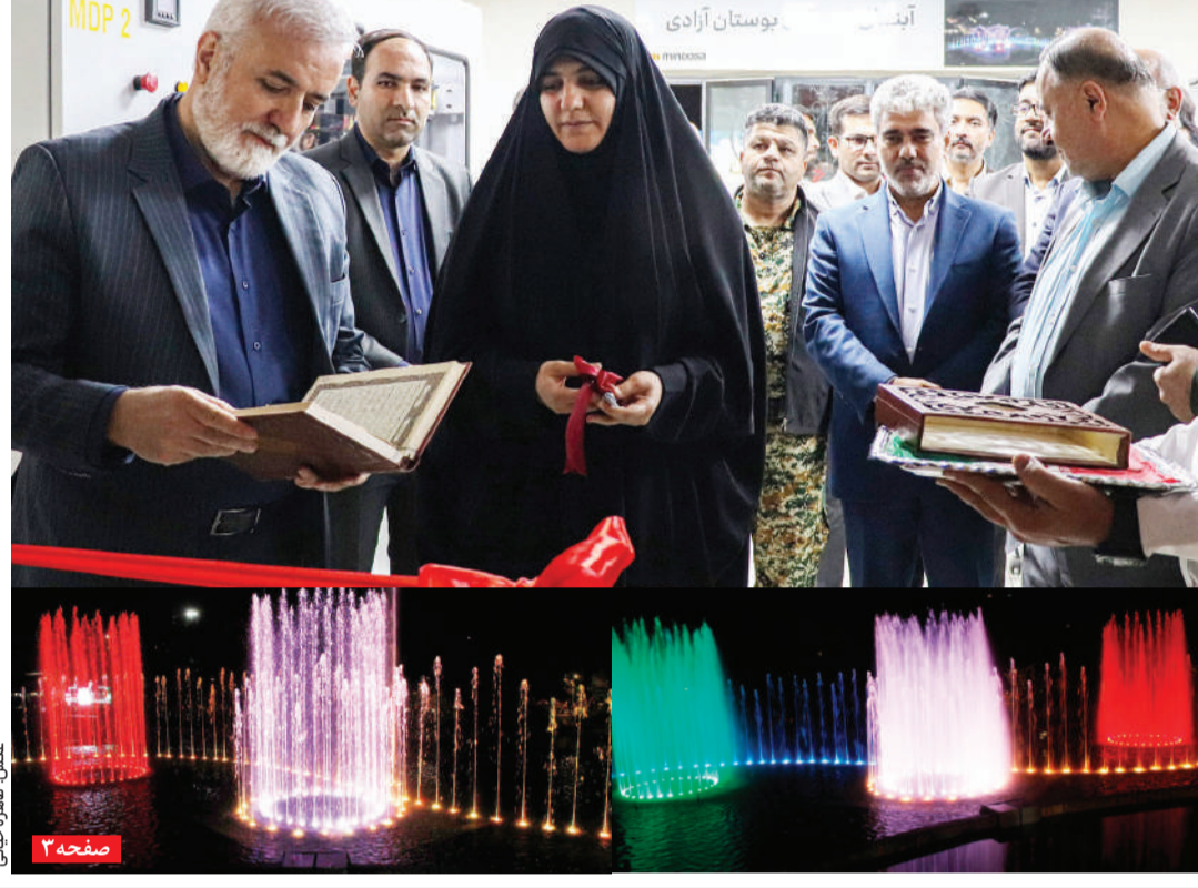
تبلور خواست مردم