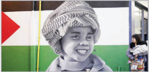
نقاشی دیواری در حمایت از فلسطین در شهر دوبلین ایرلند