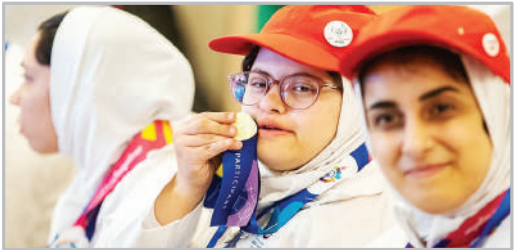
مراسم تقدیر از مدال‌آوران المپیک ویژه