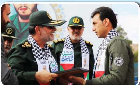
گروه خبر - نجمه فتنی

به گزارش سبحان برگزاری اولین جشنواره فرهنگی ورزشی کارکنان وظیفه سپاه پاسداران انقلاب اسلامی به میزبانی مرکز رزم مقدماتی حضرت احمد ابن موسی (ع) نیروی دریایی سپاه در شیراز در حال برگزاری است.